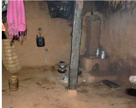
Situatie voor en na plaatsing ICS

Deze ICS zorgt ervoor dat 75% van de rook door het rookkanaal wordt afgevoerd en spaart 40% van het hout uit. Bovendien is het vuur omgeven door een wand waardoor kinderen zich niet langer kunnen branden. De ICS is al in andere delen van Nepal een groot succes gebleken, en na de pilotfase binnen het project in Dhading, waarin 120 huishoudens van een ICS werden voorzien, is de vraag binnen de gemeenschap groot. Wij hebben een flink bedrag gereserveerd waarmee de komende jaren 600 ICS zullen kunnen worden geïnstalleerd. Omdat het prototype nog niet aan alle eisen voldeed werden er in 2009 nog aanpassingen gedaan. Hetgeen voor een iets lager plaatsingscijfer heeft gezorgd.