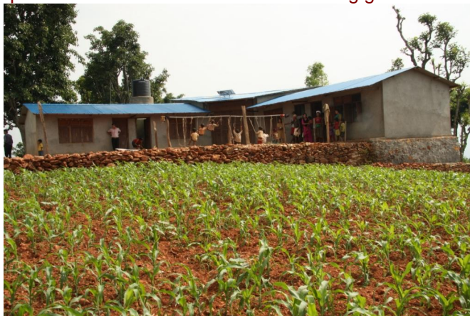
Het daycare centre in Maidan: nu vol in bedrijf

Een belangrijk onderdeel van de projecten in Dhading, waarin diverse millenniumdoelen te benoemen zijn, is het opzetten van zes zorgcentra. Onze stichting heeft de financiering van de bouw van dit - meest afgelegen - centrum in het dorpje Maidan voor haar rekening genomen. In het 3 e kwartaal van 2010 is het centrum in gebruik genomen. Wij hebben besloten alle jaarlijkse kosten voor het laten draaien van dit centrum vooralsnog voor onze rekening te nemen. Daarnaast hebben wij voor dit gebied tevens een deel van de kosten tbv de verbouwing van het Child Birth Centre (CBC) en de kosten van het inrichten van alle centra, zowel de schooltjes, healthposten + verloskamer voor onze rekening genomen.